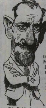
Çizim: David Levine

Telefonda ya da topluluklar önünde kendini ifade ederken hissettiği yetersizlik hissini belki de sayısız günde onu bulan mektuplarla kapatan Stein-