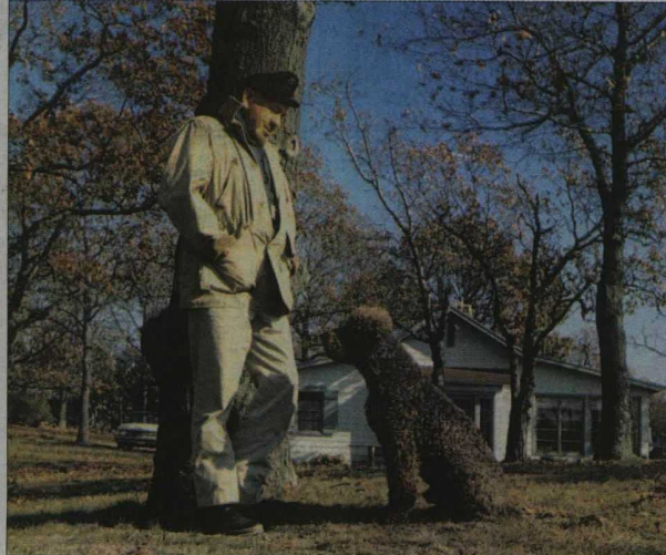
Steinbeck bir "yazar"dır, bundan başka bir itki onu harekete geçiremez, "Kaleminin zihninin ürünlerinin hıza yetişemeyeceği korkusu"yla durmadan yazar.

Başarılı, ün sahibi, kanaat önderi bir yazar olma tutkusu taşımaz Steinbeck.